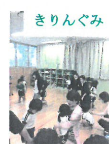
パパ・ママから離乳食