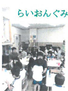
絵本のおよみかせ