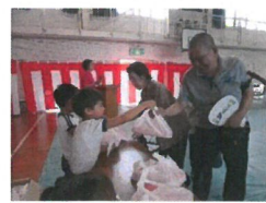
おみやげを 手渡しました。