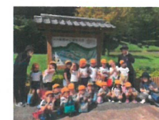
「川の水はつめたね。」