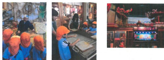
「すてきなうちわができましたよ!」

手漉き和紙を体験しました。八女市は、和紙工芸も さかんで、お盆のちようちんが、たくさん飾られていました。 その他竹細工の実演を見たり、灯笼人形のビデオや人形 を見ました。