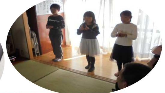
かんげいのことば