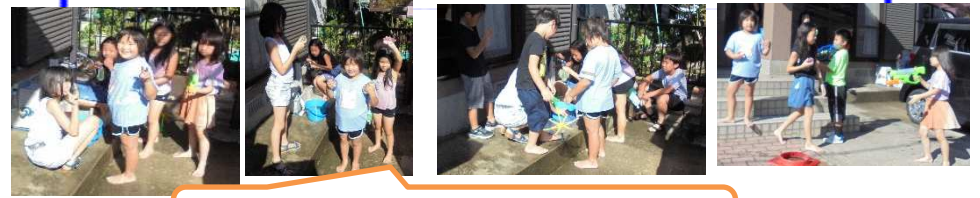
自由時間に水遊びを楽しみました。