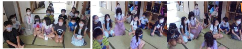
お楽しみ会で、いろいろな出し物を考え司会や進行も自分たちでしました。とても楽しかったです。