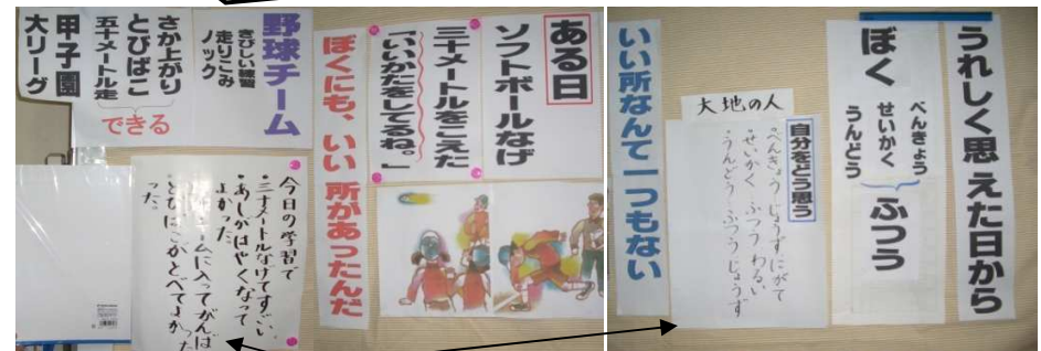
こどもたちのはつげん 「うれしく思えた日から」の板書

教材「うれしく思えた日から」をつかって、自分の良さに気づきのばして行こうと努力する大切さについて話し合いました。