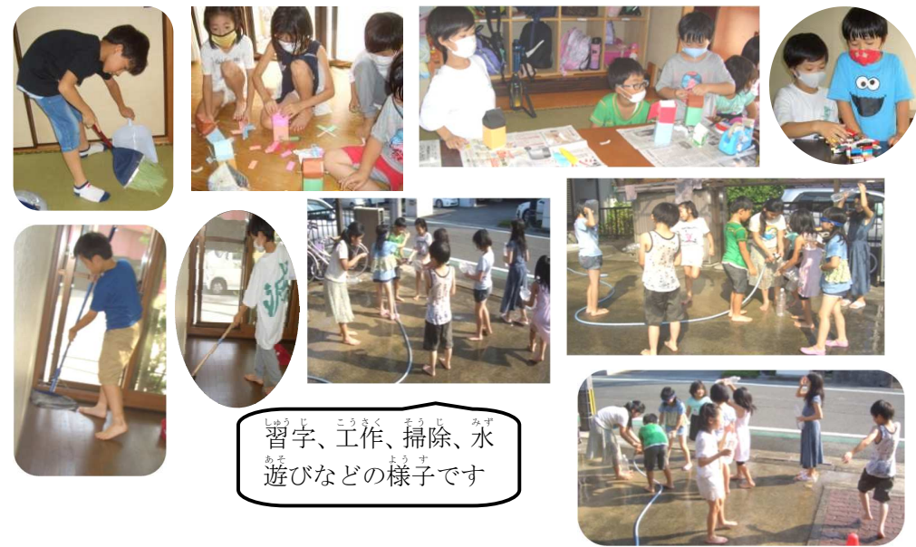
習字、工作、掃除、水遊びなどの様子です