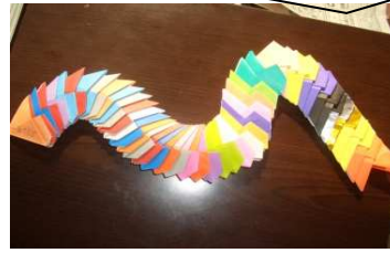
くねくねスリンキー

子ども達はじっとしていることより動きまわる方が好きで外での遊びを好みます。最近、みんなでよくドジボールをしています。下の写真は、わくわくタイムで作った折り紙の作品です。