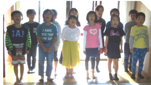
がんばってうたったよ!